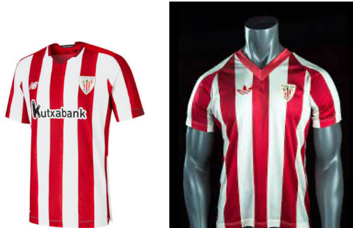
Figura 5: La camiseta actual del Athletic (izquierda) y la camiseta de la temporada 1985-1986 (derecha).

que Athletic intenta crear y alimentar la imagen de rechazar todas las fuerzas económicas extranjeras a pesar de que han aceptado los patrocinadores internacionales.