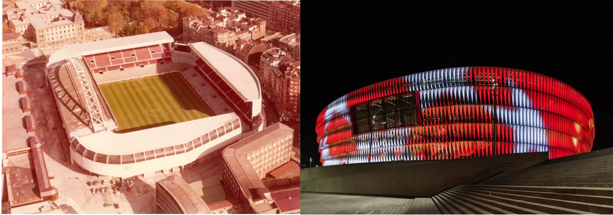
Figura 7: El original San Mamés en uso 1913-2013 (izquierda) y el nuevo San Mamés en uso 2013-presente (derecha).