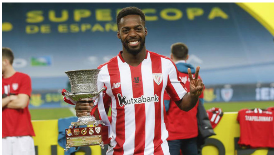
Figura 8: Iñaki Williams levantando el trofeo de la Supercopa de España en enero de 2021