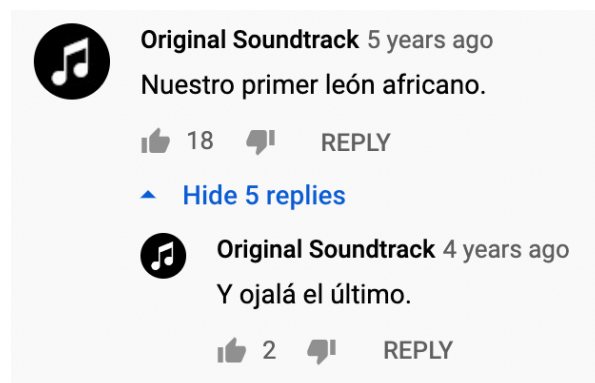
Figura 3: Uno de los comentarios racistas debajo de la entrevista con Iñaki Williams publicado en el canal oficial del Athletic.

El comentario siguiente, el que recibió mucha más atención en esta sección de comentarios también usa la lengua de animalización, pero es dividida en dos partes y sigue con una frase amenazante. El primer comentario dice, “Nuestro primer león africano.” Cómo se puede ver en la captura de pantalla más abajo, lo interesante es que el comentarista escribió este primer parte hace cinco años, pero escribió el segundo parte hace cuatro años. La segunda parte es una respuesta a su propio comentario y dice “Y ojalá el último” (Original Soundtrack).