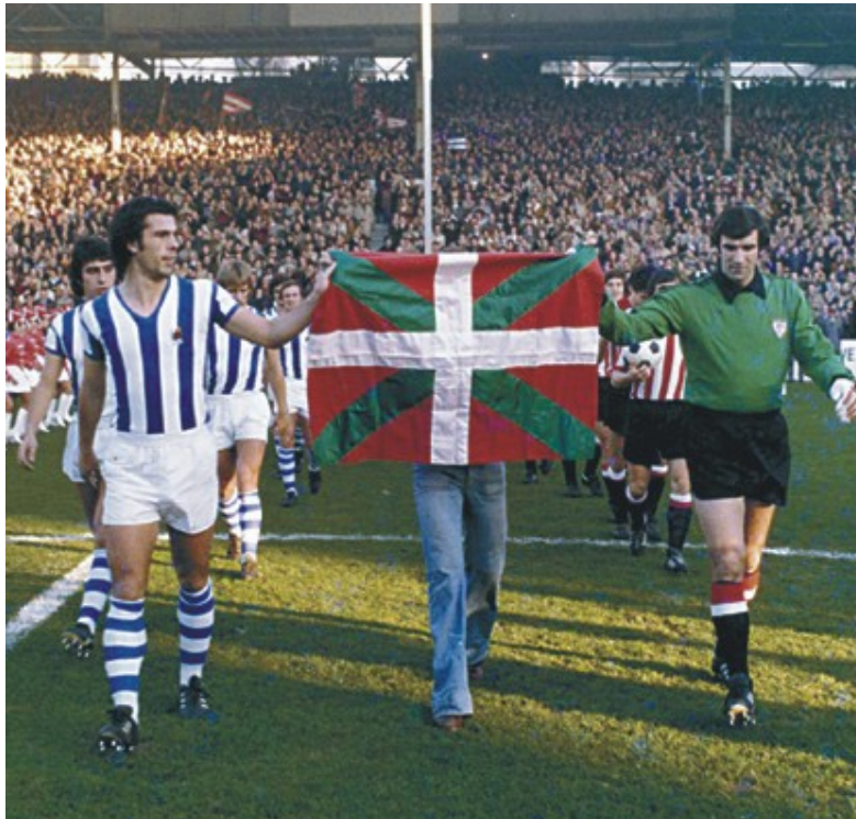
Figura 1: Los capitanes del Real Sociedad y el Athletic Club, Inaxio Kortabarría (izq.) y José Ángel Iribar (der.), llevan la Ikurriña al campo juntos.

respuesta al asesinato de dos miembros de ETA en septiembre de 1975, el portero del Athletic, José Ángel Iribar, llevó un brazalete negro para honrar a las víctimas de los asesinatos. Luego en 1976, Iribar se negó a jugar con el equipo nacional (López, 87). Iribar, a quien muchas personas consideran el jugador más importante de su periodo, también es famoso por llevar la Ikurriña (la bandera vasca) al campo durante el partido entre el Athletic y Real Sociedad.